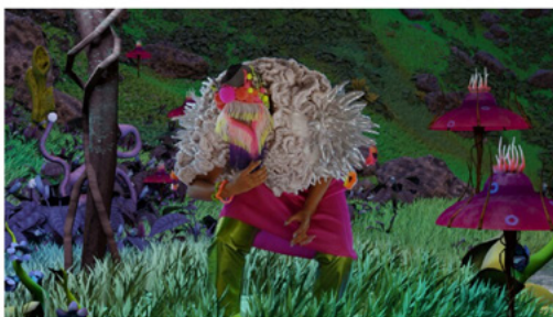
Kunst van Joséfa Nijam te zien tijdens Noorderlicht Biënnale. © Joséfa Nijam