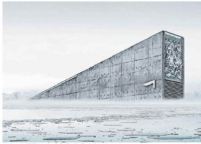
Arctic vault (2023) is te zien in De Proef in Frederiksoord. FOTO: MICHAEL NAJJAR

Het werk van Michael Najjar (en vele anderen) is nog tot en met 7 september te zien op vier locaties tijdens de Noorderlicht-ambassade Machine Entanglements. Vandaag en morgen zijn er om 14.00 uur rondleidingen in Niemeyer in Groningen. Zie ook noorderlicht.com