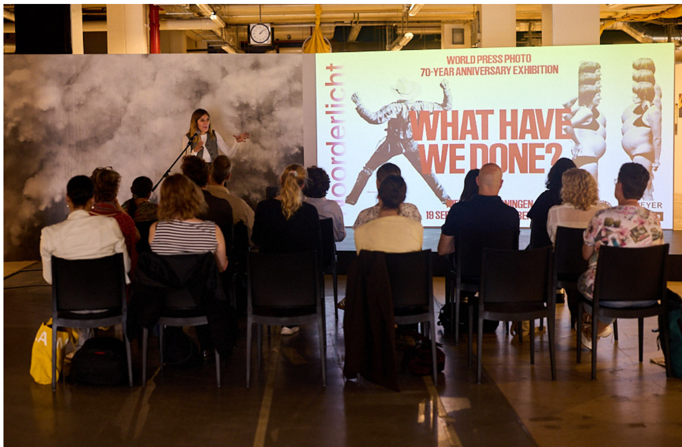
Lezing en workshop What Have We Done?, ism World Press, Niemeyerfabriek 2025.