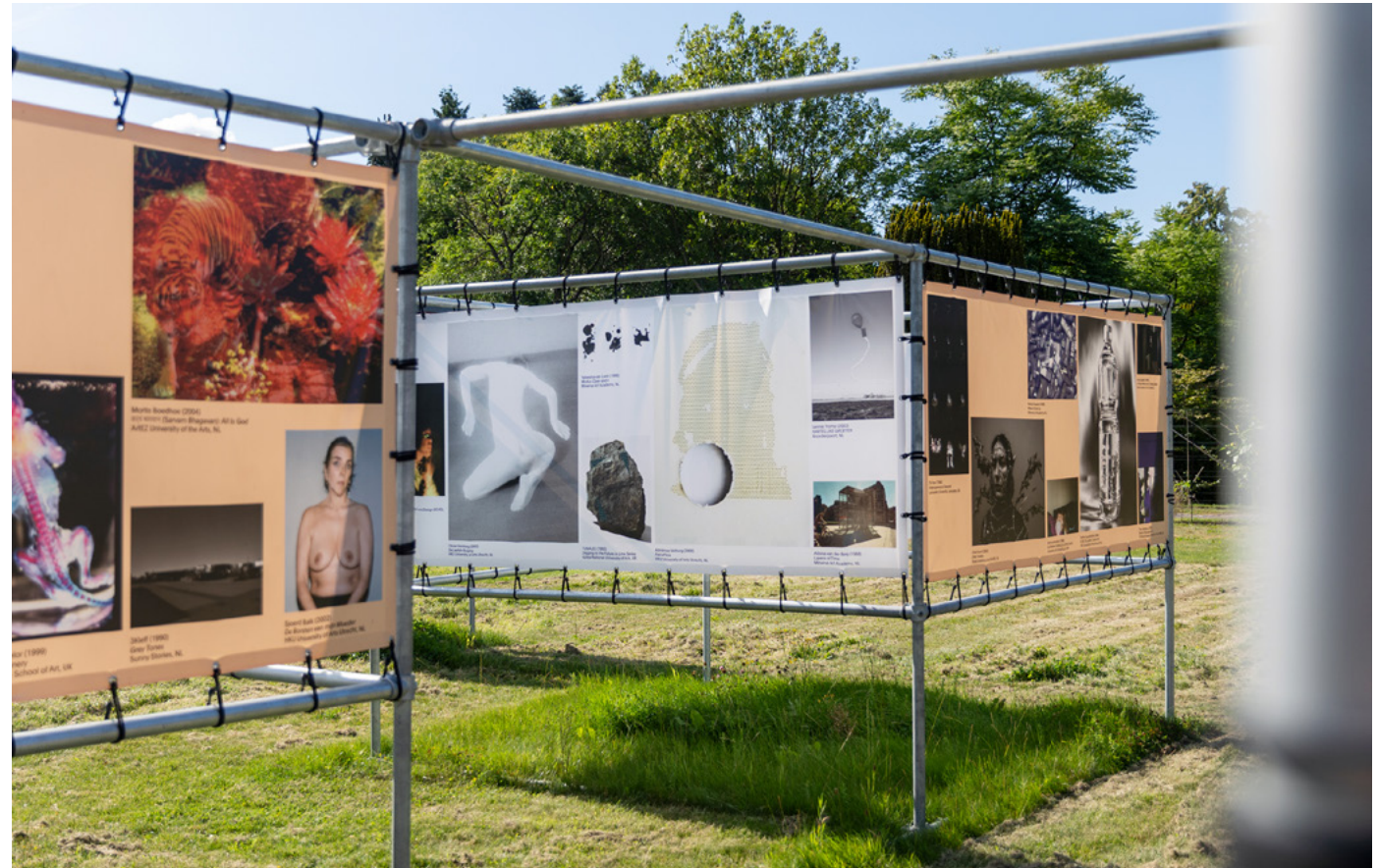
Studenten tentoonstelling Machine Entanglements , met 82 fotos van studenten van 32 internationale academies. Locatie: De Proef, Drenthe.

In 2025 hebben we onze eigen uitgeverij Aurora Borealis (wetenschappelijke naam voor poollicht op het noordelijk halfrond, ofwel het noorderlicht) nieuw leven ingeblazen. Waar de uitgeverij de afgelopen jaren wat op de achtergrond was geraakt, hebben we haar opnieuw geactiveerd als