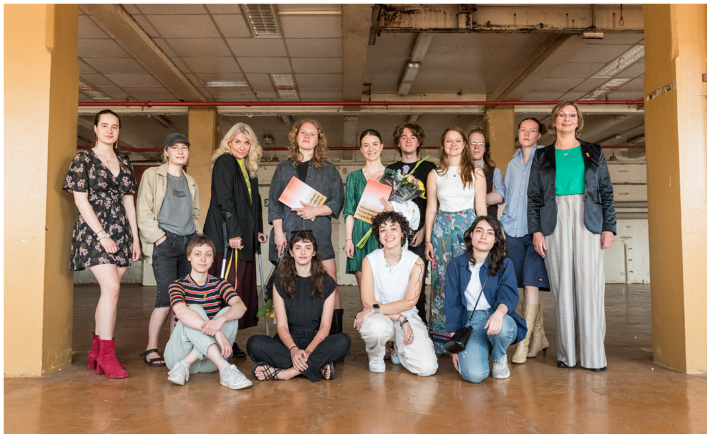
Genomineerden en winnaars Noorderlicht Award 2025, Niemeyer Fabriek Groningen.

In 2025 werd ook een belangrijke stap gezet in het ontwikkelen van een nieuwe leerlijn rond mediawijsheid en fotografie via een leergemeenschap met scholen. In dit traject werd onderzoekend en thematisch gewerkt aan bewustwording van de impact van social media, waarbij leerlingen via fotografie en nieuwe media reflecteerden op hun eigen digitale gedrag en representatie. De samenwerking met leerkrachten bleek hierin essentieel: door nauwe afstemming kon educatief aanbod direct aansluiten bij de leefwereld en ontwikkelingsfase van leerlingen.