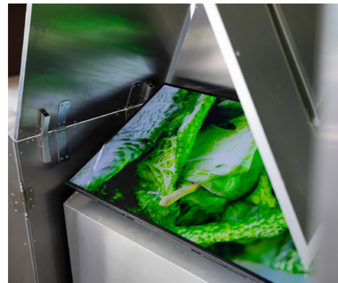
Machine Entanglements : Diana Gheorghiu, You Are Light and Cabbage , video en metaal tabernakel, sculptuur, 2025. De Proef, Drenthe

Tijdens de Groninger Museumnacht trok de tentoonstelling What Have We Done? Unpacking 7 Decades of World Press Photo een breed en divers publiek. Naast vrije toegang tot de tentoonstelling konden bezoekers deelnemen aan workshops en The Great Big Angry Fake News Quiz, waarin spel en educatie werden gecombineerd om bezoekers bewust te maken van desinformatie en mediagebruik. De avond werd afgesloten met een feestelijk programma dat nieuwe doelgroepen aan Noorderlicht wist te verbinden.