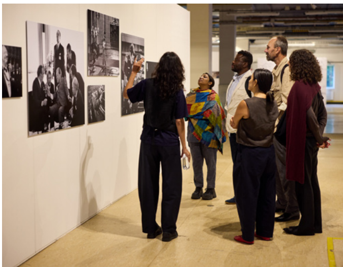
Rondleiding World Press Photo.

Van ons, voor morgen bracht verhalen uit het Groningse Slochteren samen en vormde het sluitstuk van de vierjarige samenwerking met BPD Cultuurfonds binnen het programma Hernieuwde Energie. In het project werkten bewoners en fotografen samen om persoonlijke verhalen vast te leggen rond landschap, identiteit en de gevolgen van gaswinning. Door bewoners actief te betrekken ontstond een gelaagd en participatief project dat lokale stemmen zichtbaar maakte. Het project benadrukte de rol van beeldcultuur in collectieve herinnering en maatschappelijke verwerking en droeg bij aan dialoog over regionale geschiedenis en toekomst.