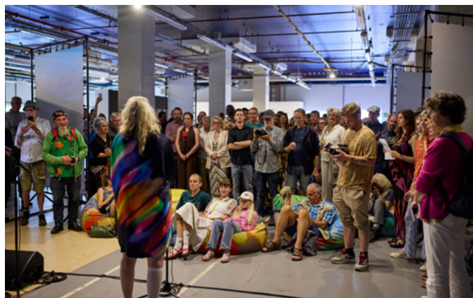
Opening Machine Entanglements in Niemeyer, Groningen.

IN FULL COLOUR bracht jonge fotografietalenten uit Nederland, Ierland en Duitsland samen rond thema's als queer zichtbaarheid, identiteit en intimiteit. De tentoonstelling onderzocht hoe zelfbeeld en verbondenheid zich ontwikkelen binnen persoonlijke en maatschappelijke contexten en hoe fotografie kan bijdragen aan herkenning en representatie. De internationale samenwerking versterkte uitwisseling tussen educatieve en culturele instellingen en sloot aan bij actuele maatschappelijke discussies rond inclusiviteit en zichtbaarheid. Door jonge makers een internationaal podium te bieden, stimuleerde het project artistieke ontwikkeling en verbreding van perspectieven binnen hedendaagse beeldcultuur.