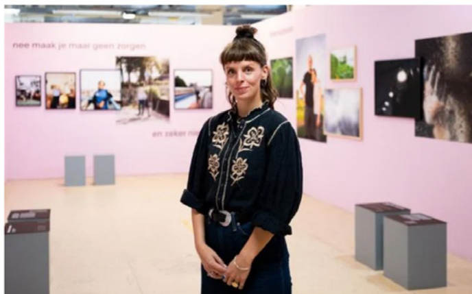
Fotograaf Jedidja Smalbil op de expositie 'Rauw Vermogen' in de voormalige fabriek van Niemeyer in Groningen.