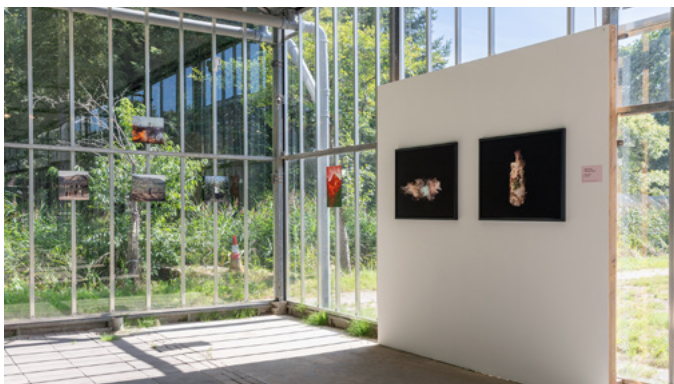
Machine Entanglements : Ioana Cirlig, The New Empire , fotografie, 2017–heden. De Proef, Drenthe

In 2026 zetten wij een volgende stap. We ontwikkelen een doorlopend Digital Mirror -educatieprogramma van kleuters tot ouderen, van amateur tot professional. De nadruk ligt niet alleen op kennisoverdracht, maar vooral op gezamenlijke reflectie en dialoog. Met Digital Mirror kunnen we bouwen aan een duurzaam educatief fundament dat meegroeit met de maatschappelijke en technologische ontwikkelingen van deze tijd.