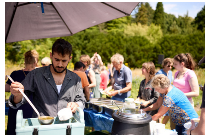
Opening Machine Entanglements bij De Proef, Drenthe.